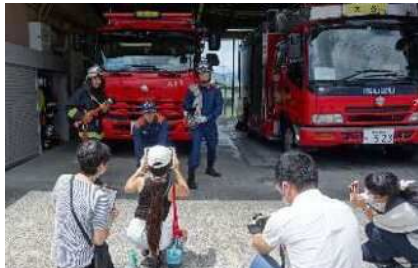
②取材の様子（消防署）