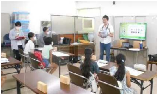
①プロ写真家による撮影レクチャー