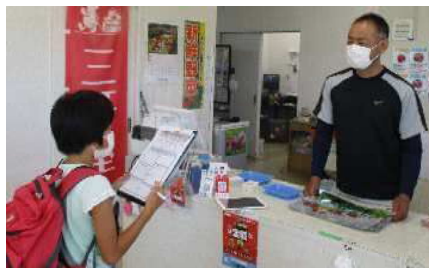
②取材の様子（三軒屋）