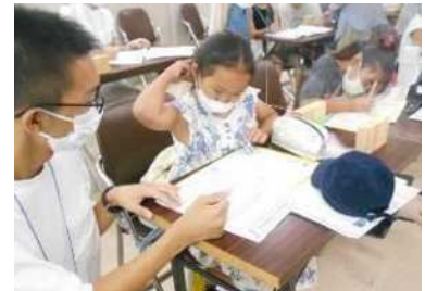
③マップ作成（下書き→清書）