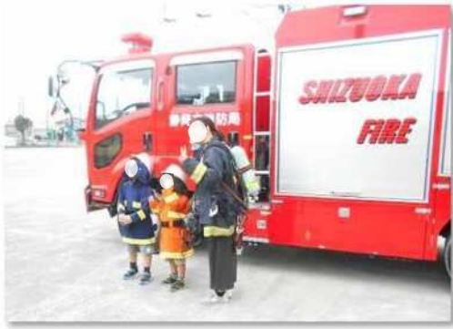
⑧ 働く自動車展 (運動場)