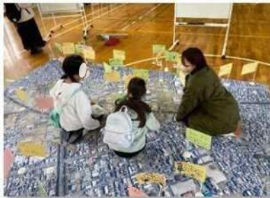
① 地域おすすめスポットマップ (地域資源マップ)