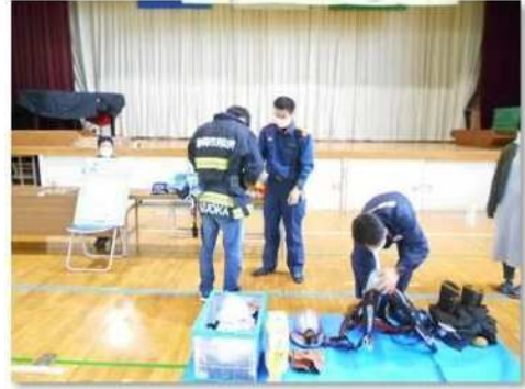
⑨ 防災・安全アドバイス (消防ブース)