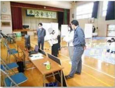
④ 区画整理事業紹介ブース