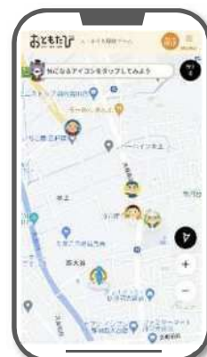
大・小まち探検ゲーム