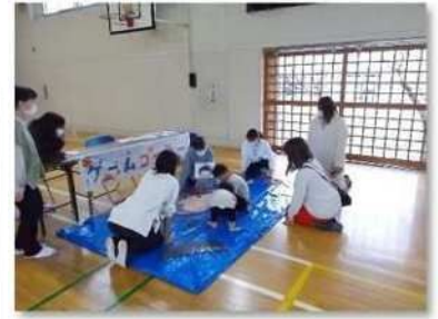
⑥ 大学生によるゲーム屋