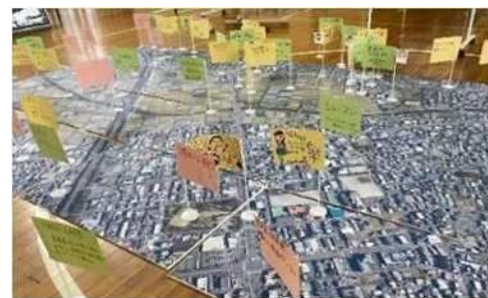
写真1: 地域おすすめスポットマップ