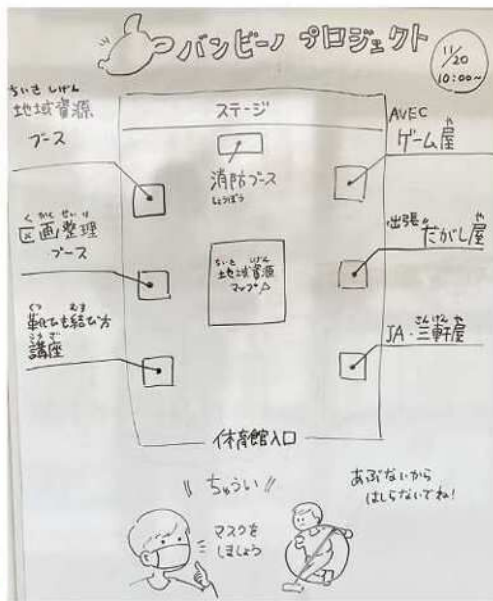
「バンビーノ・プロジェクト」配置図