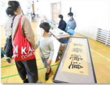
③ 校長室にある徳川家達さんの書の特別展示