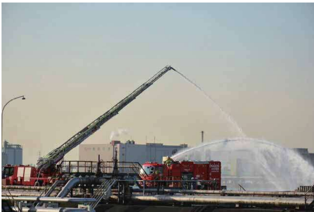
はしご付き消防ポンプ自動車・大型放水砲搭載ホース延長車 合同放水訓練