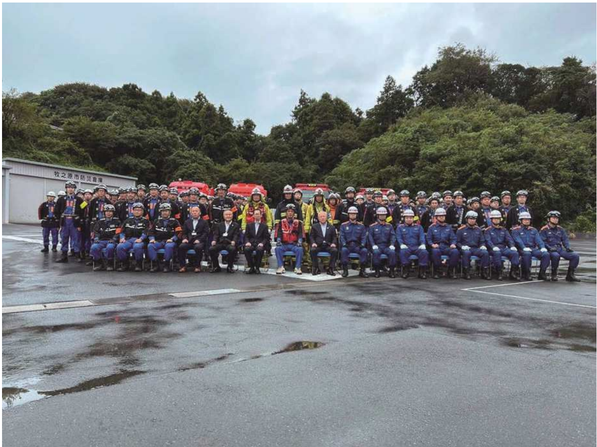
令和6年林野火災合同訓練