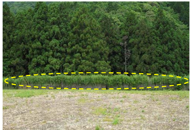
耕作放棄地の様子