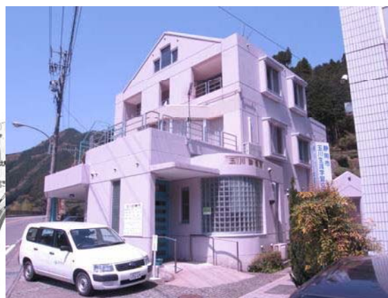
静岡市玉川診療所