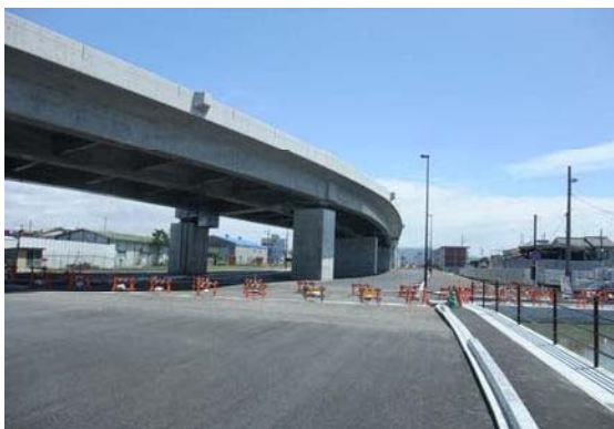
国道150号(静岡バイパス)