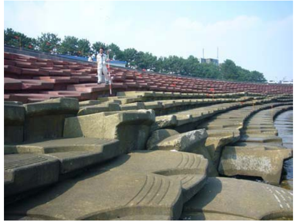
用宗漁港西側環境護岸の状況