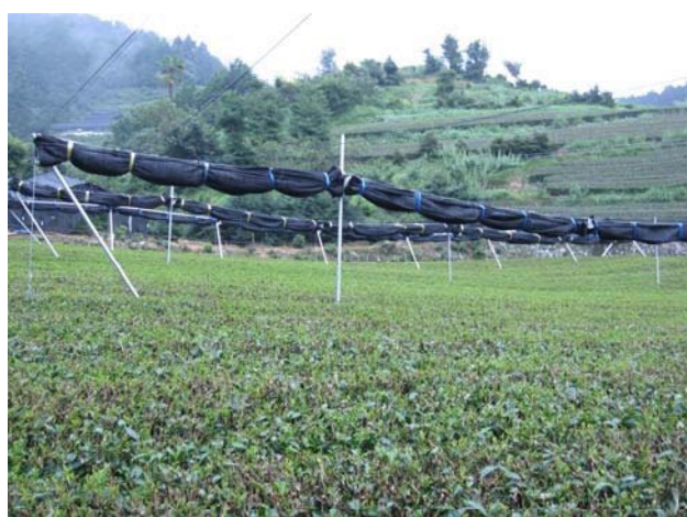
防霜用棚式被覆施設