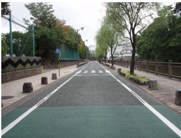
城内1号線 舗装整備箇所