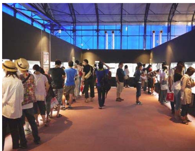
静岡ホビーフェア(2010.7.24 - 2011.3.27 開催)内の静岡ホビーミュージアムの様子