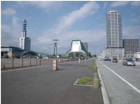
東静岡駅周辺土地区画整理事業