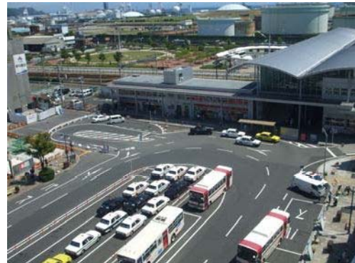
清水駅西土地区画整理事業