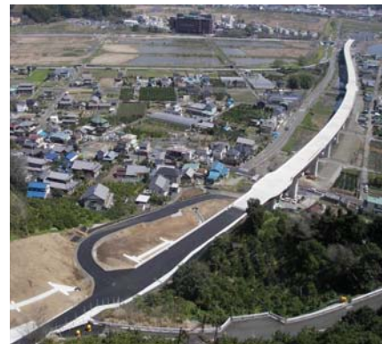
県道山脇大谷線(麻機)