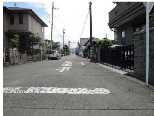
高松3号線 舗装整備箇所