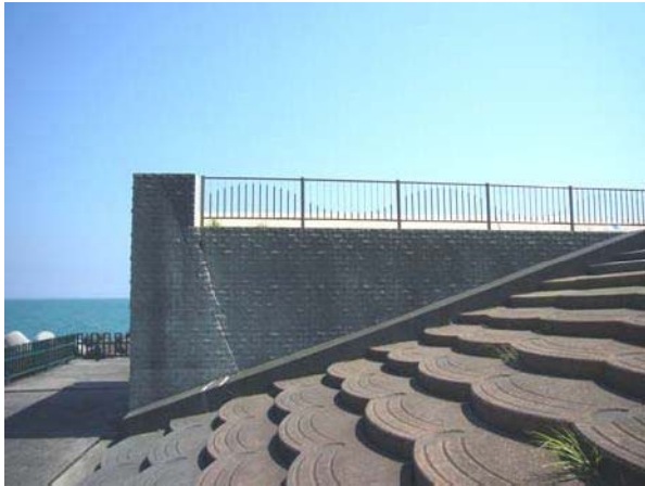
広野海岸公園の東端護岸の状況