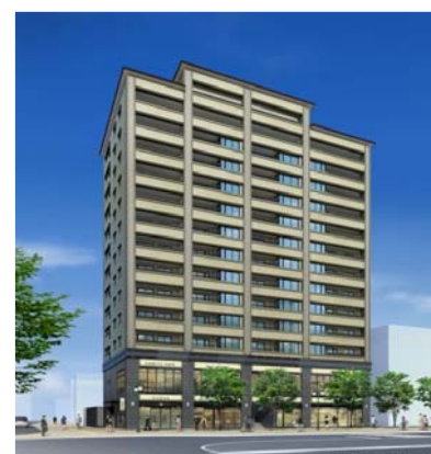
清水駅西第二地区