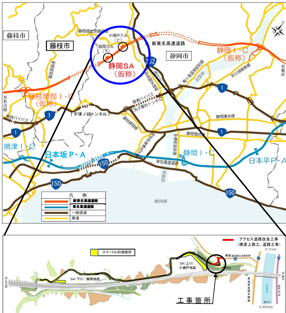
事業箇所位置案内図