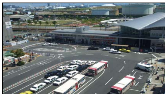
清水駅西口駅前広場