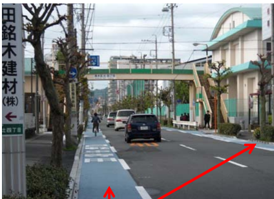
整備例(袖師村松線)