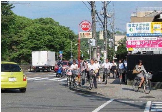
県道 静岡環状線(葵区東草深町)

○事業概要 県道 静岡環状線(葵区東草深町 外)自転車レーン整備、 県道 高松日出線(駿河区高松 外)自転車レーン整備 ほか 平成23年度整備延長4.5km