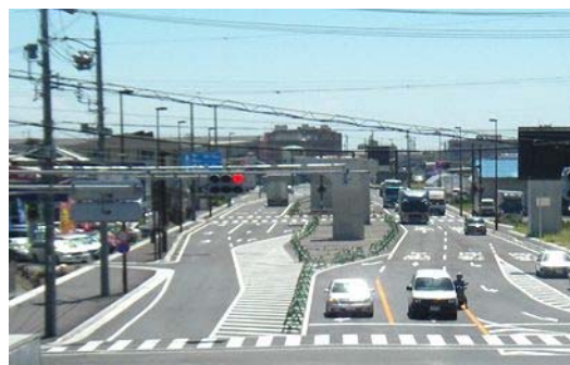
(国)150号(静岡バイパス/駿河区中島)