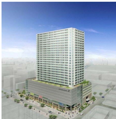
静岡呉服町第一地区