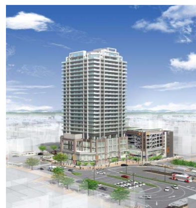
清水駅西第一地区