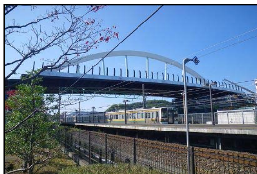
東静岡南北幹線橋梁