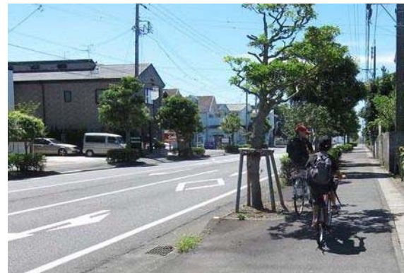
県道 高松日出線(駿河区高松)