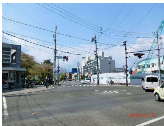
静岡環状線水落交差点