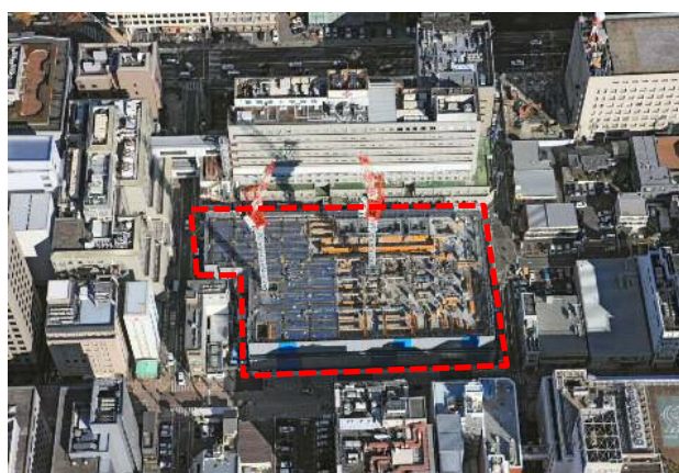
静岡呉服町第一地区市街地再開発事業(上空より)