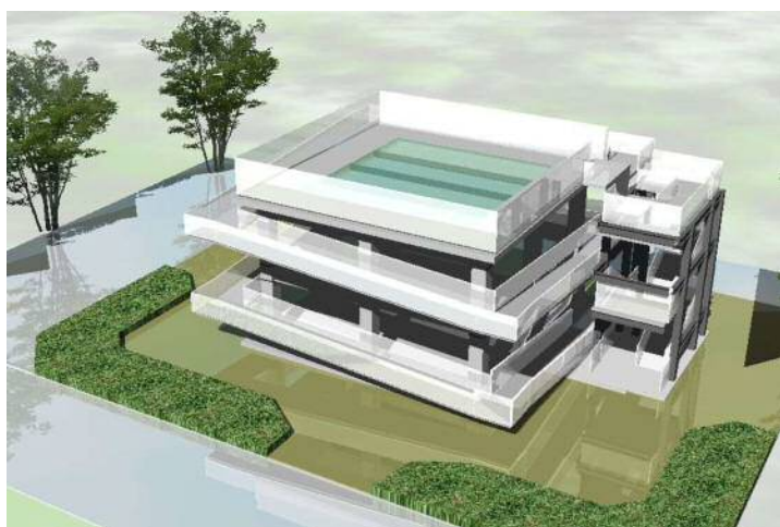
津波避難施設(イメージ図)