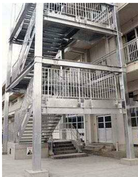
津波避難階段の設置イメージ