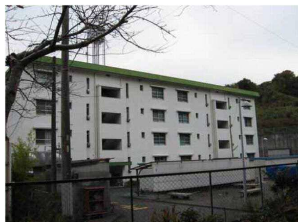
大沢荘団地(清水区蒲原神沢)