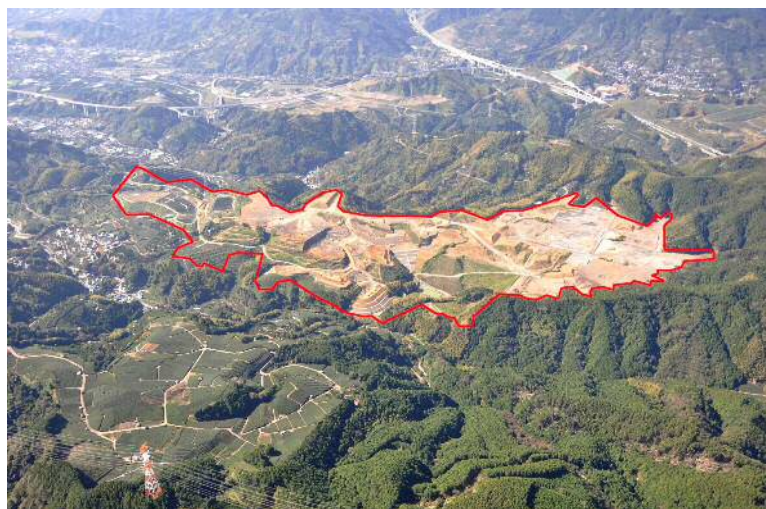
県営畑地帯総合整備事業(茂畑地区)