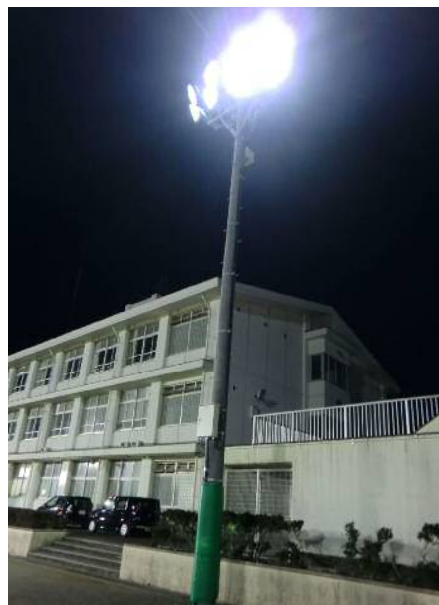
夜間照明施設の設置例