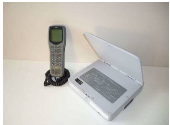
衛星携帯電話の例