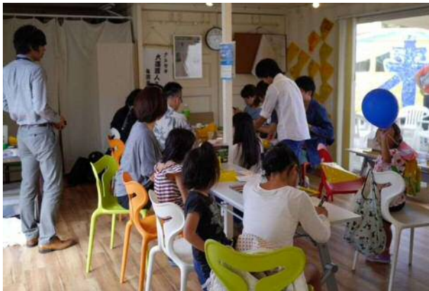
まちづくり活動の様子