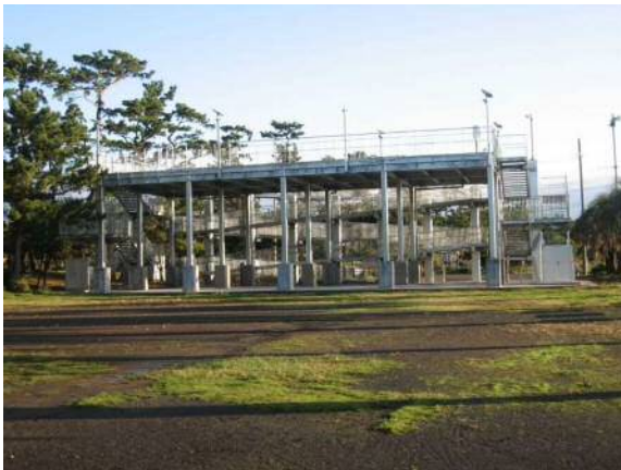
津波避難施設の例(駿河区西島)