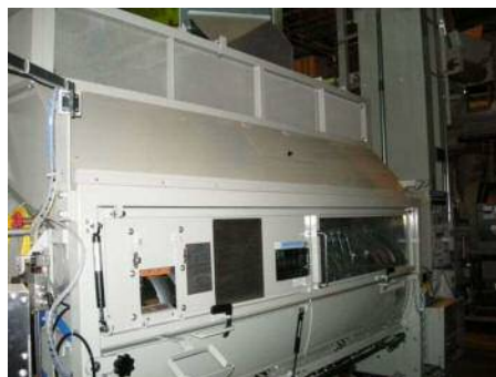
製茶機械の例(中揉み機)