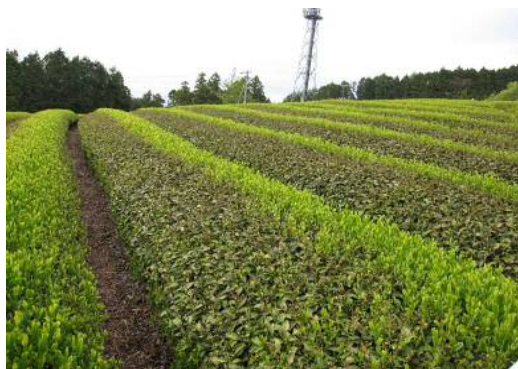
昨年の凍霜害の被害状況※新芽が褐色に変化している