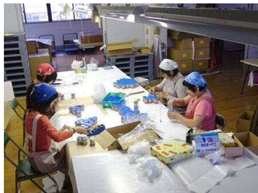
静岡授産センターにおける作業の様子