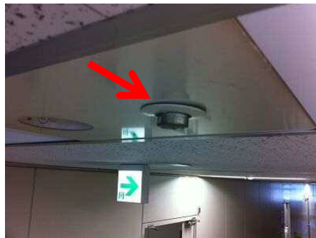
スプリンクラー設備の設置例