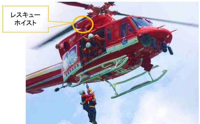
消防ヘリコプターレスキューホイスの使用例