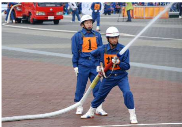
消防団の活動の様子