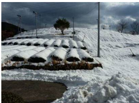
葵区梅ヶ島地区 積雪状況