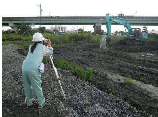
建設業研修の様子