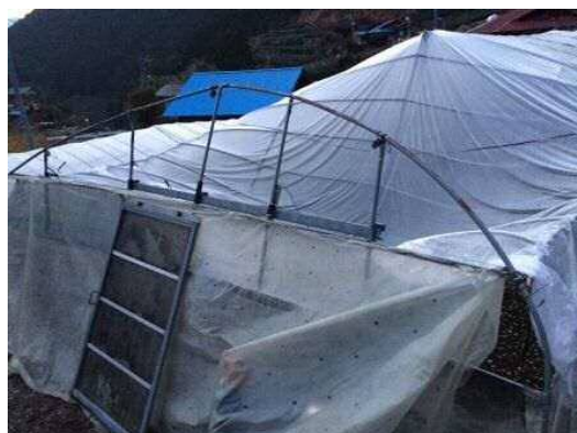
葵区有東木地区 わさび育苗ハウス