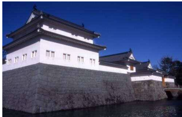
駿府城公園(東御門、巽櫓)