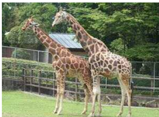
アミメキリンの例