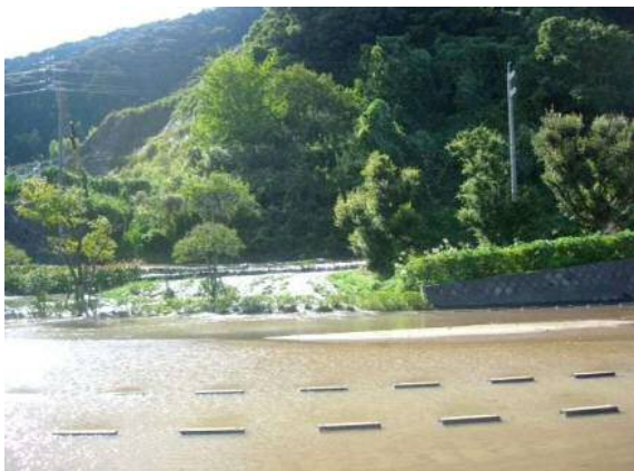
静岡斎場の被災状況