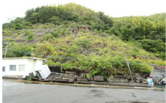
中央卸売市場の被災状況