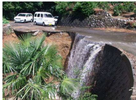
農道杉山保全1号線(清水区杉山)の被災状況