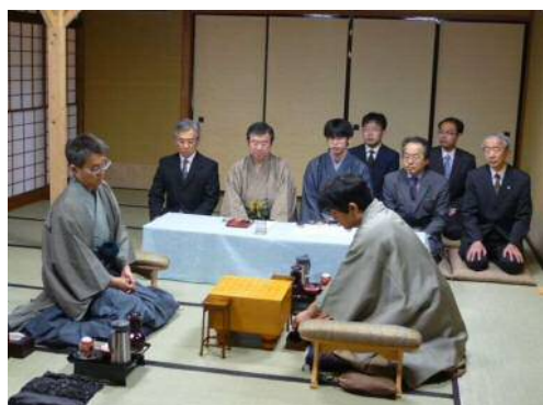
第70期将棋名人戦の様子