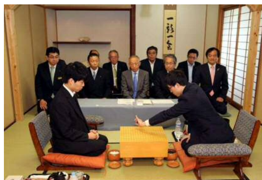
囲碁基本因坊戦の様子