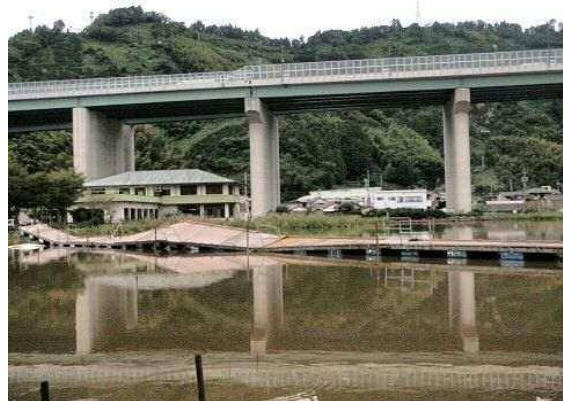
鯨ヶ池浮棧橋の被災状況