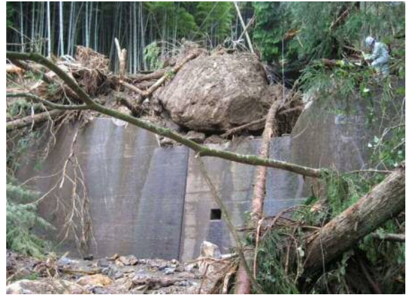
とずらざわ 清水区葛沢の被災状況