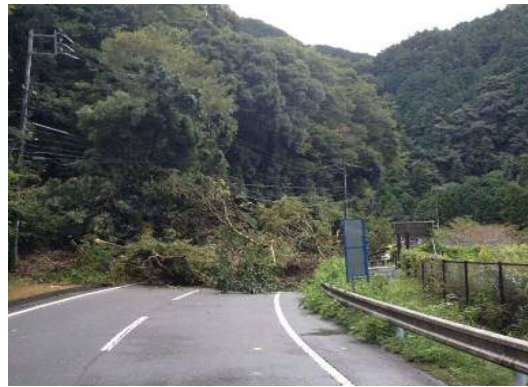
(主)清水富士宮線(清水区和田島)の被災状況