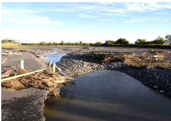
安倍川河川敷スポーツ広場(葵区弥勒)の被災状況