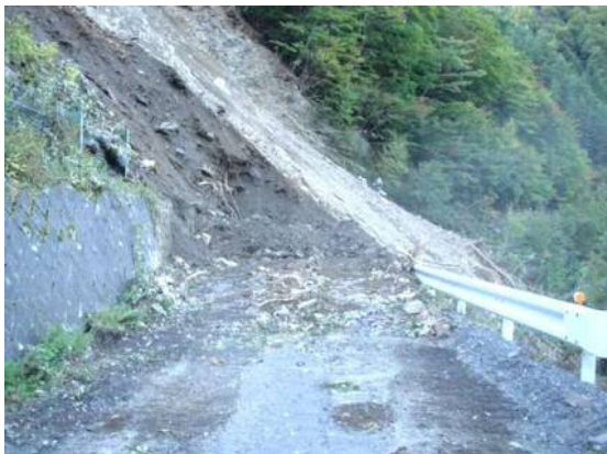
林道東俣線(葵区田代)の被災状況