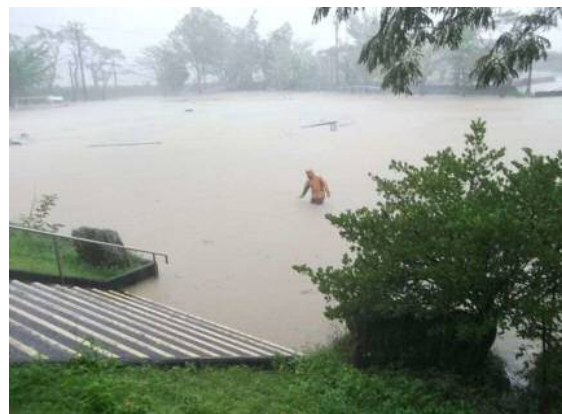
松野小学校の被災状況