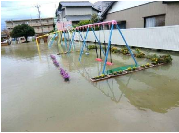
清水高部幼稚園の被災状況