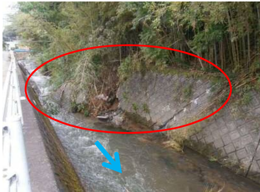
(準)門屋川(葵区門屋)の被災状況