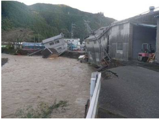
(市)新聞本線(葵区新聞)の被災状況