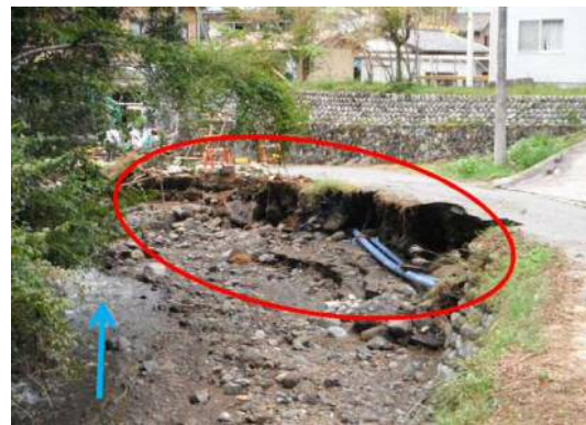
宮沢(清水区小河内)の被災状況