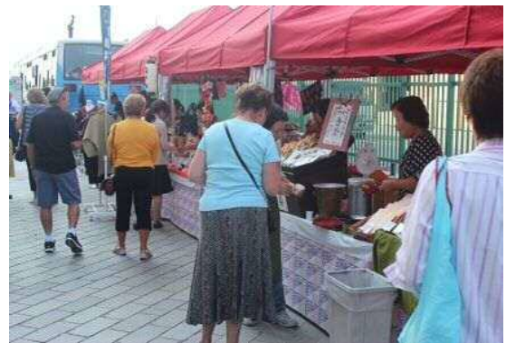
昨年実施したマルシェの様子