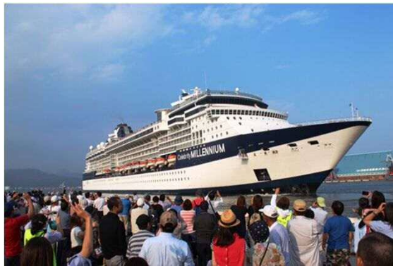
客船「セブリティ・ミレニアム」寄港