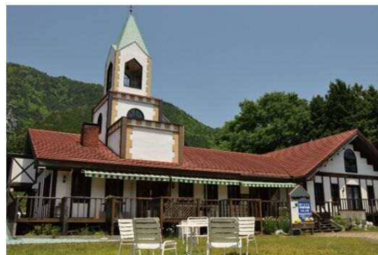
南アルプスユネスコエコパーク井川ビジターセンター