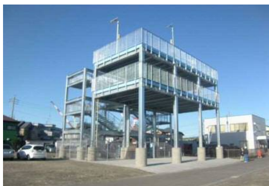
津波避難タワー 整備イメージ