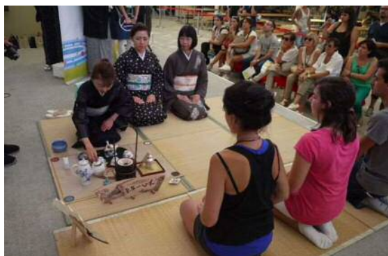
ミラノ博でのイベントの様子