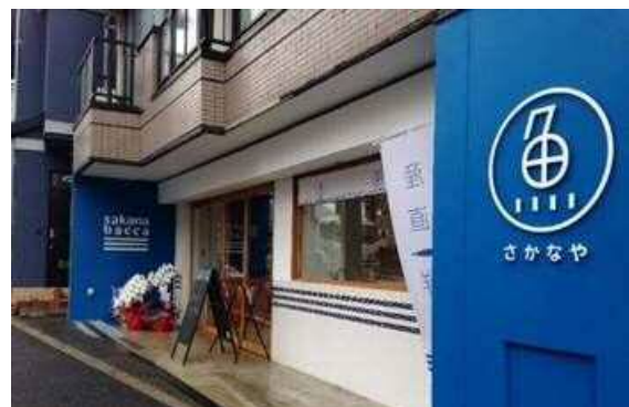
アンテナショップ設置予定店舗(東京都目黒区内)