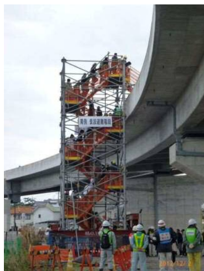
国道150号バイパス 社会実験の様子