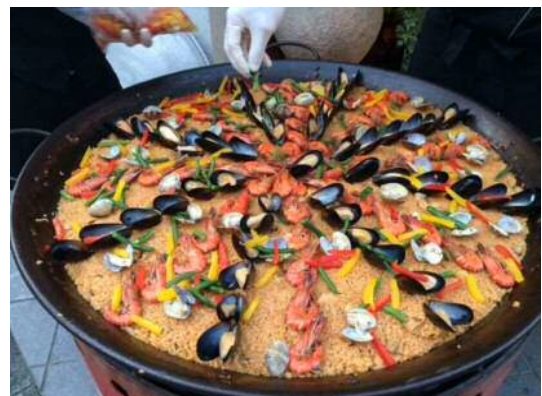
イベントで提供される巨大パエリア(イメージ)