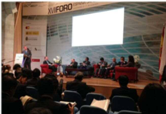
日本・スペイン・シンポジウム 第17回会議の様子 (スペイン・サンタンデル)