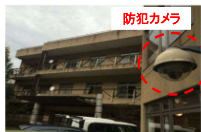
福祉施設の防犯カメラのイメージ