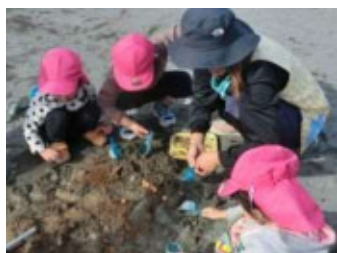
認定こども園の様子