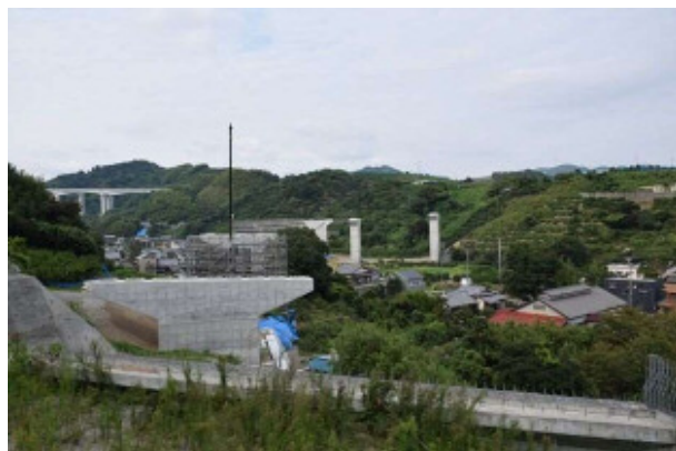
(主)清水富士宮線(庵原～伊佐布)