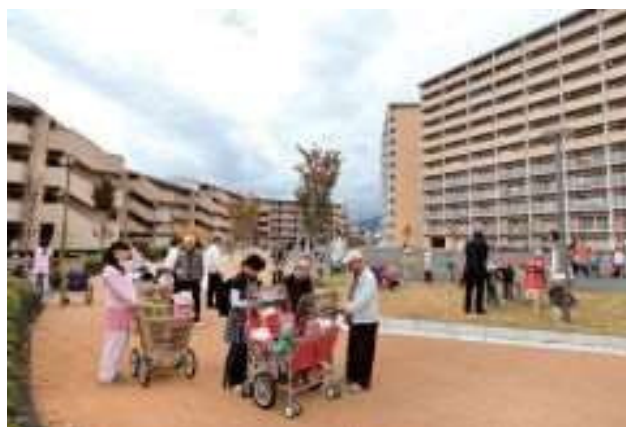
生涯活躍のまち(CCRC)のイメージ