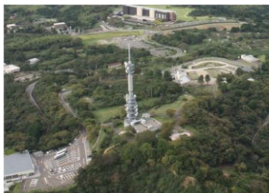
日本平山頂の写真