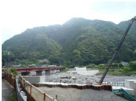
(主)梅ヶ島温泉昭和線(渡/大河内橋)