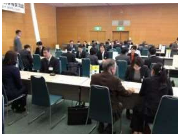
就職等相談会の様子