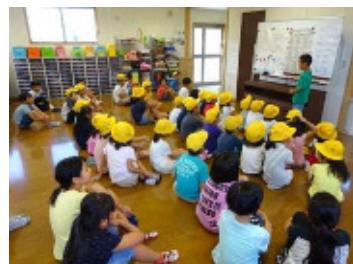
放課後児童クラブの様子