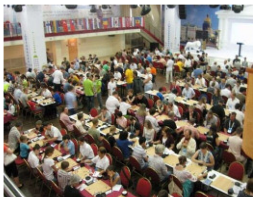
ヨーロッパ碁コンgresの様子