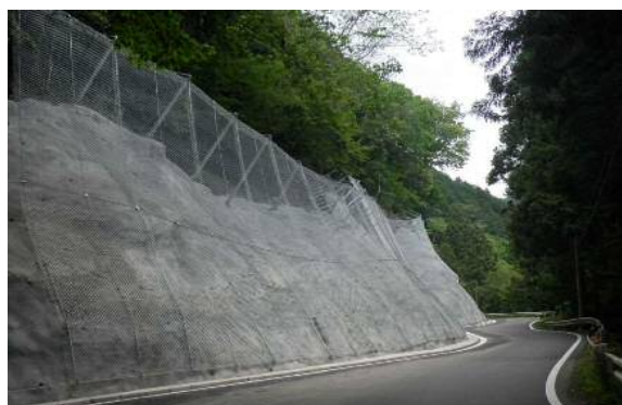
法面对策の施工イメージ