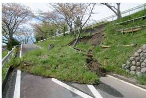
崩落した日本平動物園第3駐車場法面