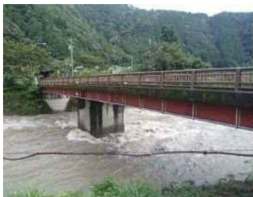
中央橋(葵区坂ノ上)の様子