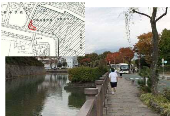
駿府城公園周辺ランナーの様子 (イメージ)