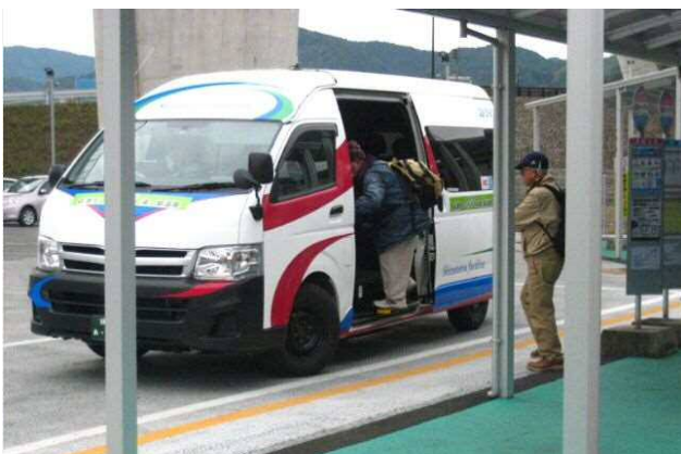
自主運行バスの利用イメージ