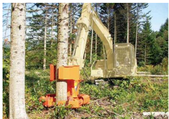
フェラーバンチャ