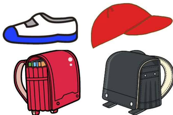
学用品のイメージ