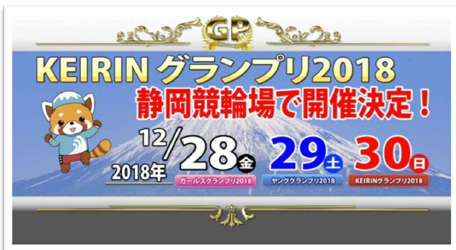
KEIRINグランプリの開催