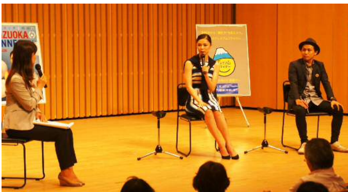
プレミアムフライデー(シンボルイベント)の様子