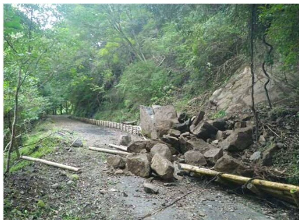
林道神沢原線(清水区中河内)の様子