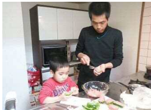
男性の家事参画のイメージ