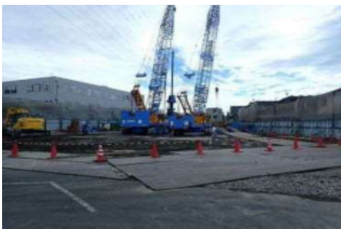
高橋雨水ポンプ場(沈砂池棟)土工事