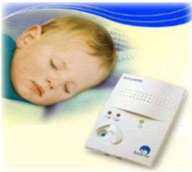
無呼吸アラーム(イメージ)