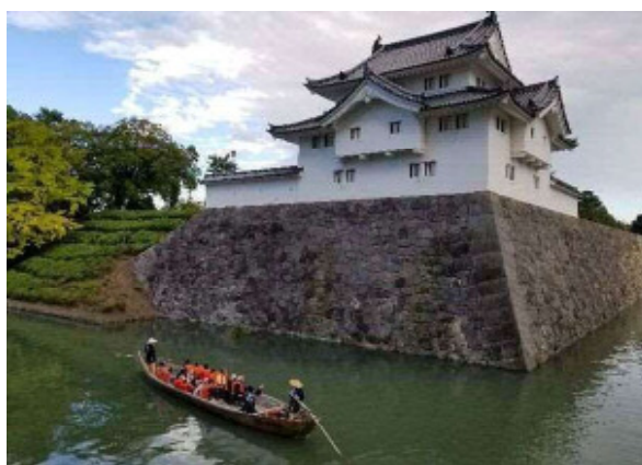
葵舟の様子(平成29年10月社会実験)