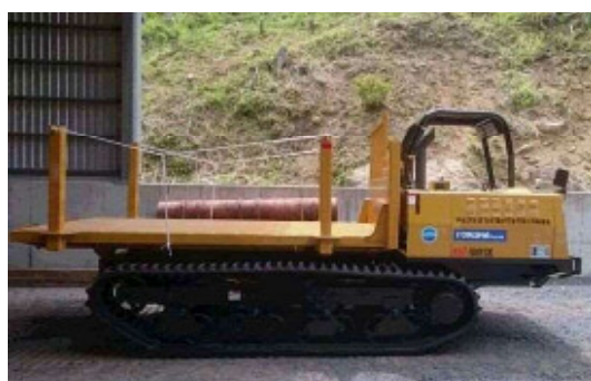
フォワーダ(運搬機械)