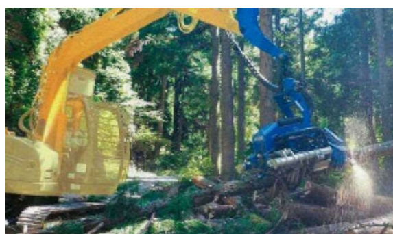
ハーベスタ(伐採機械)