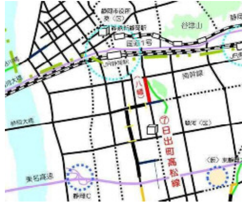
街路整備事業 (都) 日出町高松線(駿河区八幡)