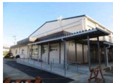
体育館改修(イメージ)