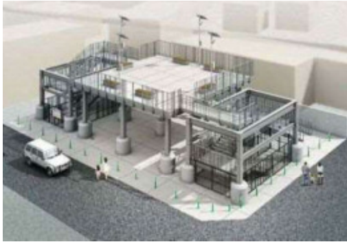
津波避難タワー 整備イメージ