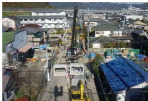
雨水渠築造工事(イメージ)