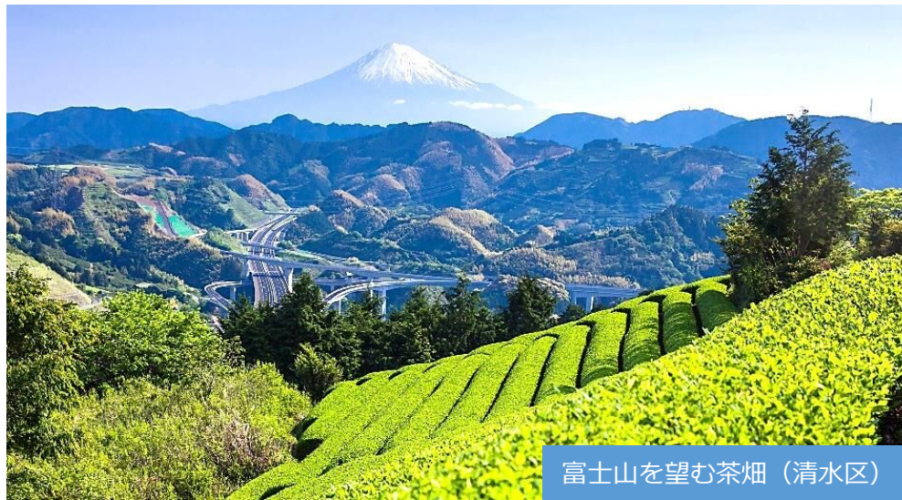
富士山を望む茶畑（清水区）