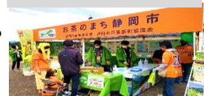
お茶啓発イベント