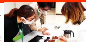
お茶を学ぶ市民向け講座