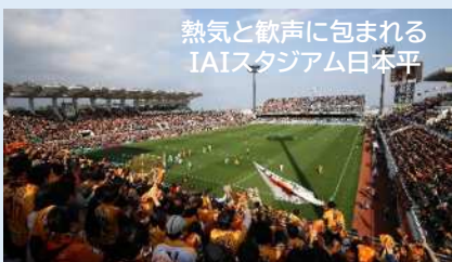
熱気と歓声に包まれる IAIスタジアム日本平