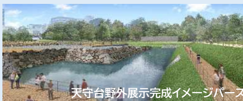
天守台野外展示完成イメージパース

文化遺産+デジタル技術で「ありし日の駿府城」の姿を、ワクワクしながら体験できる空間を作り、子どもたちの学びや観光などに活用する取組です。皆様のご支援をお願いします。