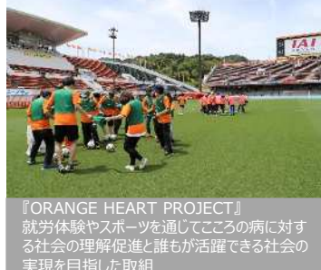
『ORANGE HEART PROJECT』 就労体験やスポーツを通じてこころの病に対する 社会の理解促進と誰もが活躍できる社会の 実現を目指した取組

これから先の未来、誰もが輝き続けることができるまちとなるためには、本市とチームとが連携し、スポーツが持つ力で、さまざまな地域課題の解決や地域経済の活性化に取り組む必要があります。さらに、その取組へ企業や地元の方々も参画し、共に活動することで、はじめて誰ひとり取り残さないまちが実現されます。