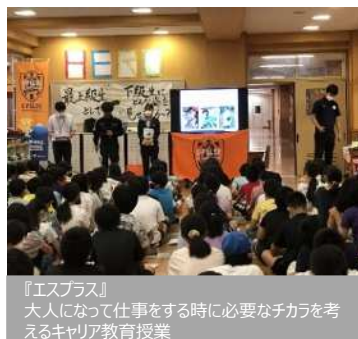
『エスプラス』 大人になって仕事をする時に必要なチカラを考 えるキャリア教育授業