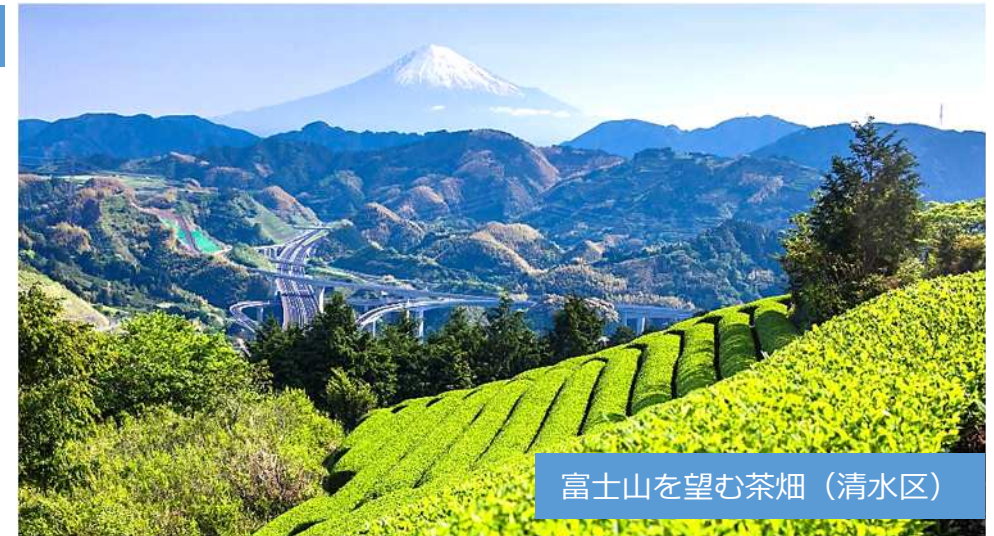
富士山を望む茶畑（清水区）