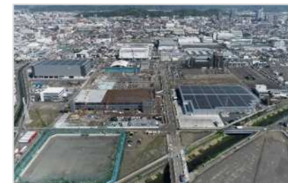
脱炭素先行地域として整備中の恩田原・片山エリア

将来にわたり安全・安心に暮らせるまちの実現 に向け、是非、ご支援とご協力をお願いします。