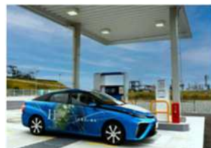
水素ステーションで水素充填中の燃料電池自動車

2050年のカーボンニュートラルに向け、2030年度までに2013年度比51%削減の目標を掲げているものの、実現するためには高いハードルを越えなくてはなりません。その達成に向けては、既存の取組の延長にとどめるのではなく、 社会システムやライフスタイルの革新 に向けた脱炭素に資する 技術革新 や新商品・サービスが必要です。