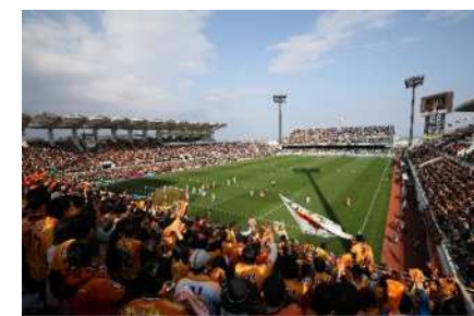
熱気と歓声に包まれるIAIスタジアム日本平