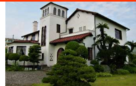
旧マッケンジー住宅再生活用事業