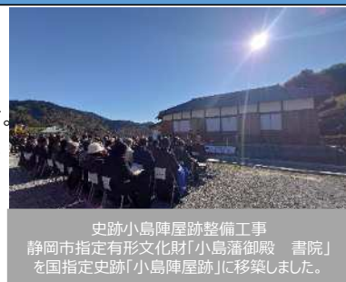
史跡小島陣屋跡整備工事 静岡市指定有形文化財「小島藩御殿 書院」 を国指定史跡「小島陣屋跡」に移築しました。

文化財を将来にわたって継承するとともに、効果的な活用を図るためには市だけの力では実現できない状況です。