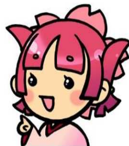
蒲原図書館キャラクター