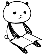
静岡市立図書館キャラクター 名もなきパンダ