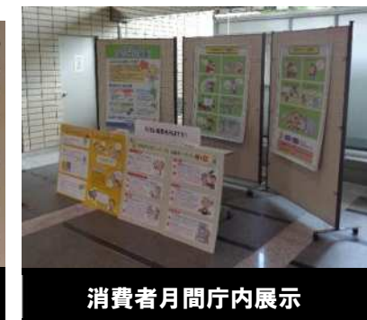
消費者月間庁内展示