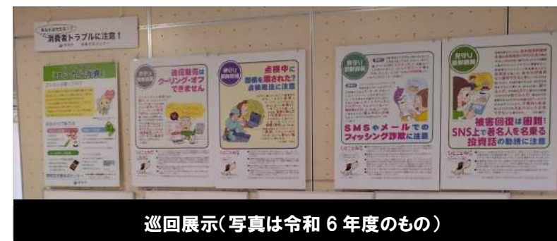
巡回展示(写真は令和6年度のもの)

国が定める消費者月間(5月)、県が定める消費者被害防止月間(12月)において庁内でパネル展示等を実施