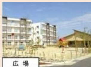
・多機能が一体化した「ひろば」