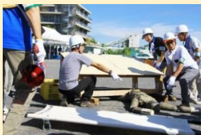
・地域防災活動の推進