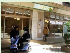
・高齢者の見守り活動