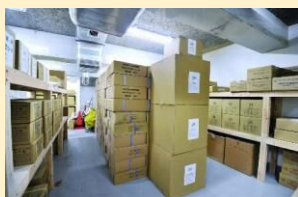
・災害発生時の被害の軽減