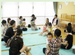
・子育て支援活動