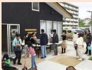
・地域に開かれた集会所