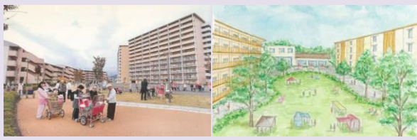
・建替えのイメージ