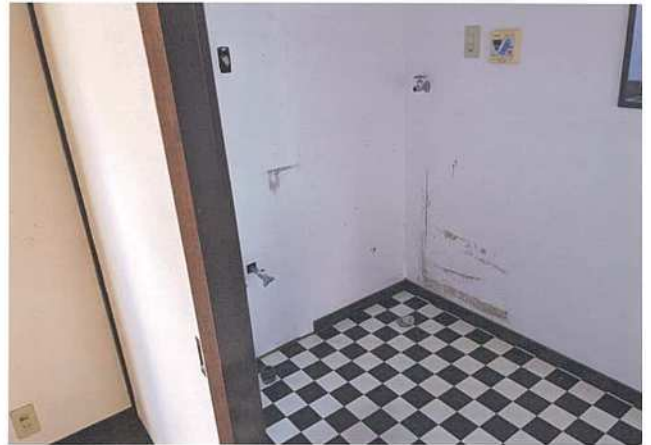
脱衣室（洗濯機置き場）