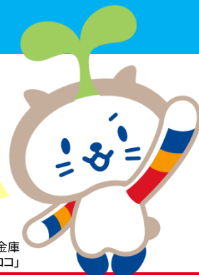
しずおか焼津信用金庫 キャラクター「たねココ」

しずおか焼津信用金庫は 持続可能な開発目標(SDGs) に取り組む地元中小事業者を支援 しています。