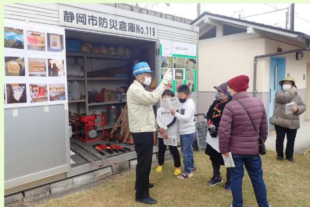
〔スタンプラリーの様子〕防災倉庫の前で、役員が参加者に資機材の説明をします。防災トイレの使い方を写真で掲示する工夫も見られます。(令和3年)

スタンプラリーなどの参加しやすい内容をきっかけに、参加したら楽しく防災訓練をして、防災の知識や意識が向上するように、心がけているそうです。