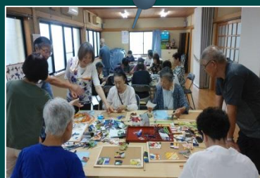
手芸の作品作り (ハンドサロン)