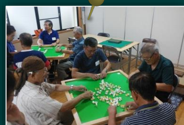
男性も多く参加する健康麻雀 (男のサロン)