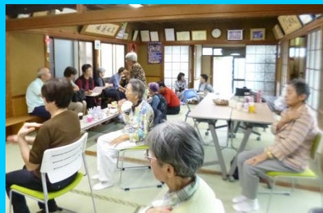
おしゃべりしてもよし！体操してもよし！

カフェ蔵では、10時になると体操が始まり、その後は輪投げや編み物、おしゃべりなど、みな自分の好きなように過ごしています。参加者からは、「ここに来るとホッとする」、「気軽に出入りできるから助かる」といった声が聞かれています。