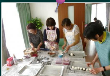
手作りのおにぎり (高いち三水クラブ)