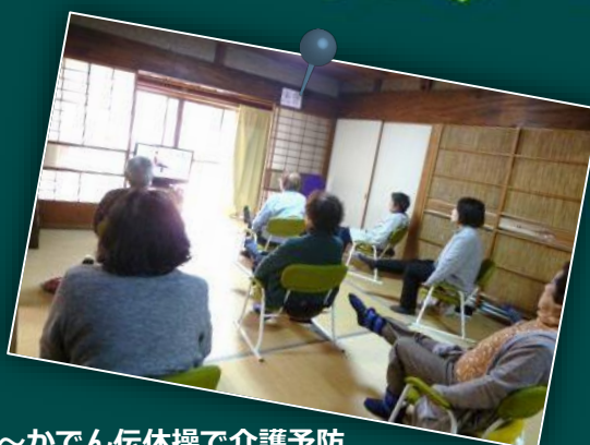
しぞ〜かでん伝体操で介護予防 (寄っちゃれ広場)