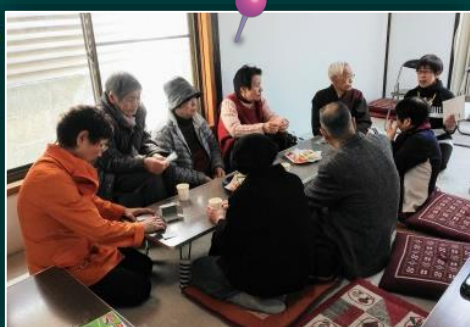
テーブルを囲んで楽しくおしゃべり (神社カフェ野バラ)