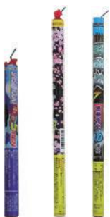
固定の必要があるもの

赤や緑の星などが続けて上がるものや、次々と内筒が打ち上がり色星などを放出するものがあります。